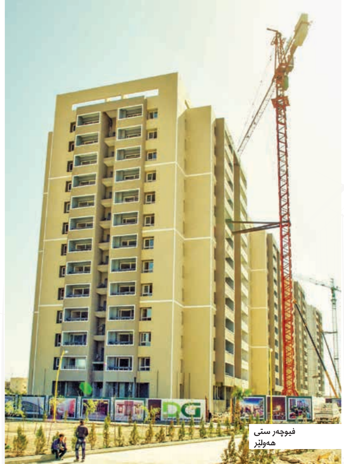
فیوچەر ستئ ههولیر