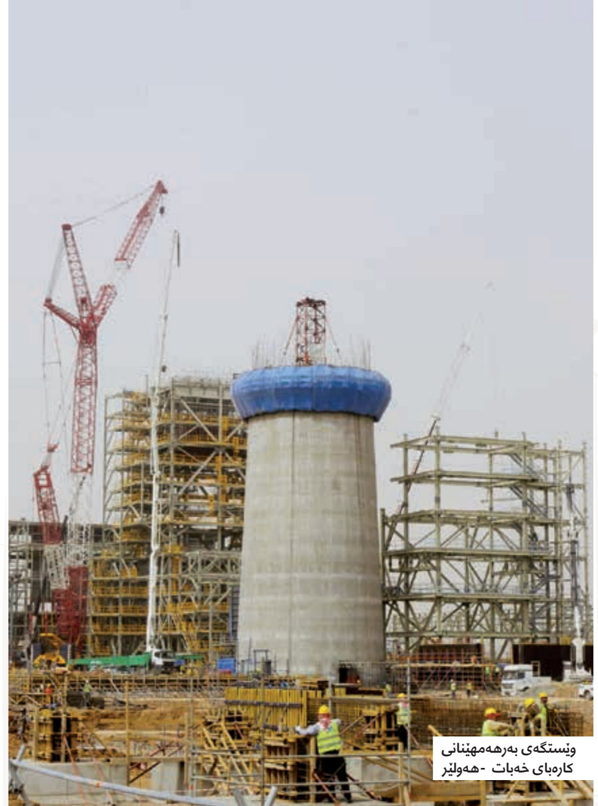
وێستگهی به‌ره‌مه‌پێنانی کاره‌بای خه‌بات - هه‌ولێر