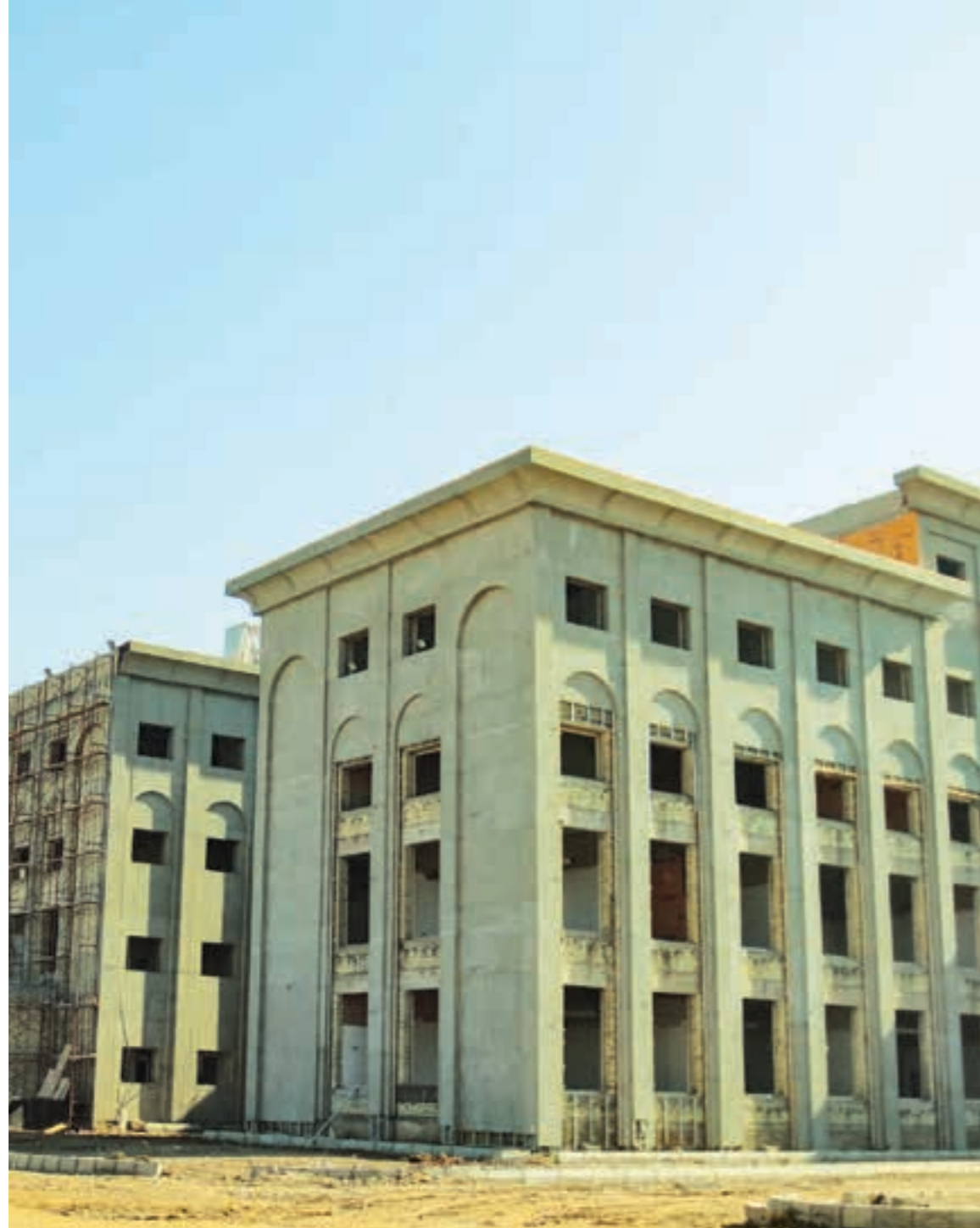
نهخۆشخانهی سه‌ربازی به‌غداد