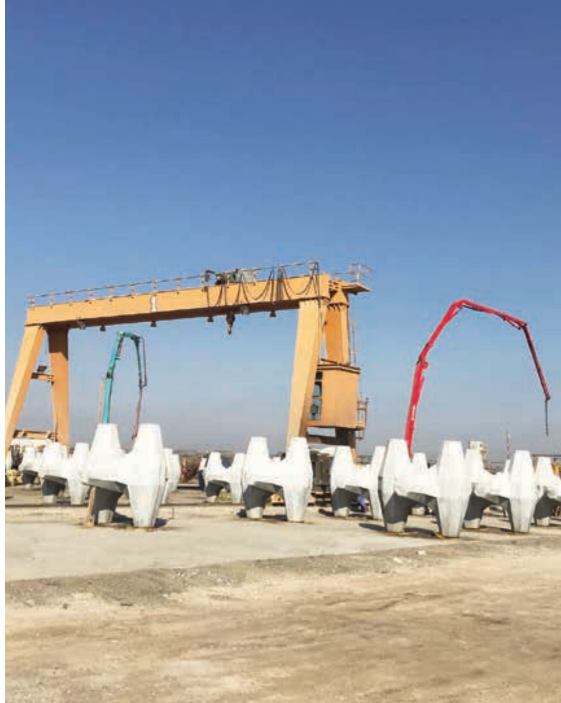
به‌ندهری فاو به‌سره