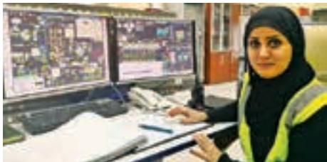
بەشداریتکردنی ھەردوو پەگەزى ئێر و مین ھۆکارە بۆ بەرھەمھێنانی زیاتر لە کارەکانماندا