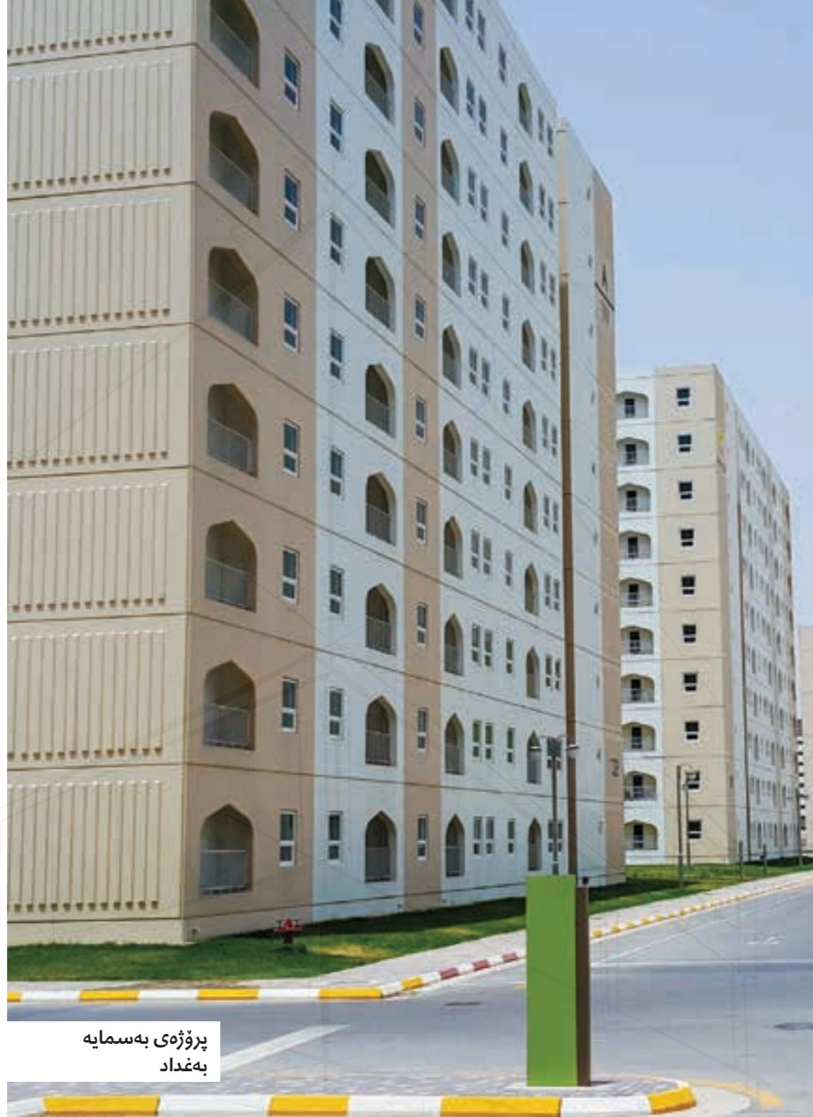
پروژهی بهسماپه بهغداد