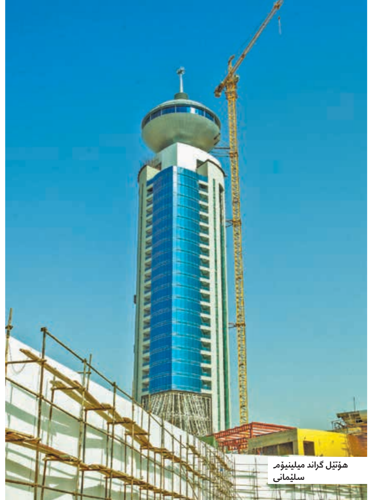
هوتيل گراند ميلينيوم سليمانى