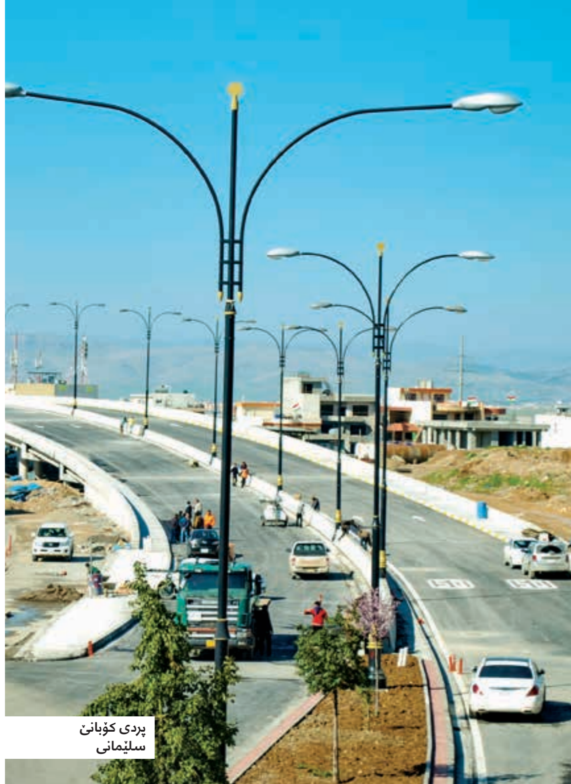
پردی کۆبانئ سلیمانئ