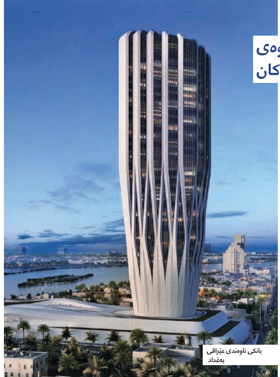
بانکی ناوهندی عیراقی بهغداد

په‌کۆک له دوایین پروژه‌کانی ته‌لارسازی به‌ناوبانگی عیراق زه‌ها حه‌دید (1950 - 2016)، بریتییه له پروژه‌ی بیناسازی بانکی ناوهندی عیراقی له بهغداد (CBI) له‌سه‌ر روبراری دیجله. ئه‌م پروژه‌یه شیوازیکی ناوازی هه‌یه به‌وهی که رووبه‌ری فراوانبوونی باله‌خانه‌که له سه‌ره‌وه بۆ خواره‌وه‌یه، واته له خواره‌وه هه‌تا به‌ره‌وه سه‌ره‌وه بچین رووبه‌ری باله‌خانه‌که فراوانتر ده‌بیت. به‌ها سه‌ره‌کییه‌کانی ئه‌م باله‌خانه‌یه بریتییه له: پته‌وی، جینگیری، به‌رده‌وامی. لافارج عیراق شانازی ده‌کات به‌وهی که به‌شیکه له‌و پروژه گرنگه له عیراقدا.