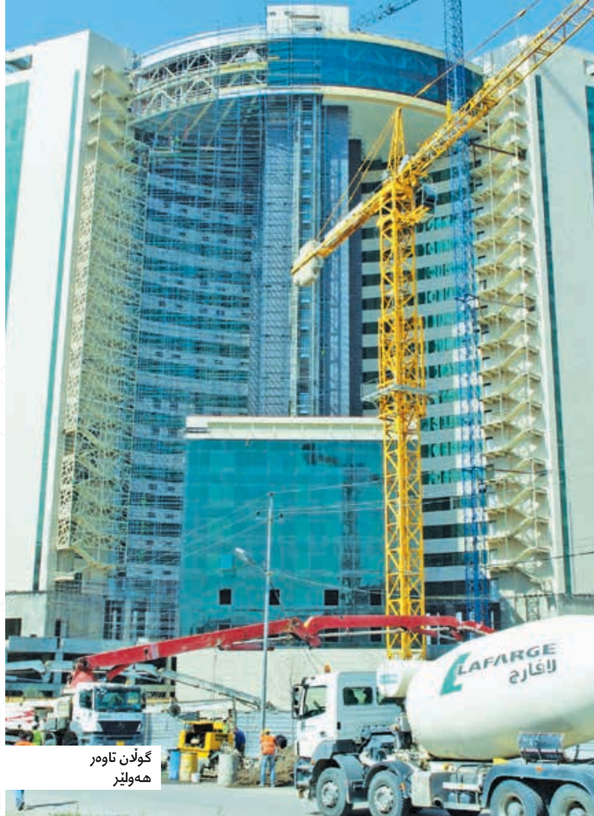
گولن تاوهر ههولير